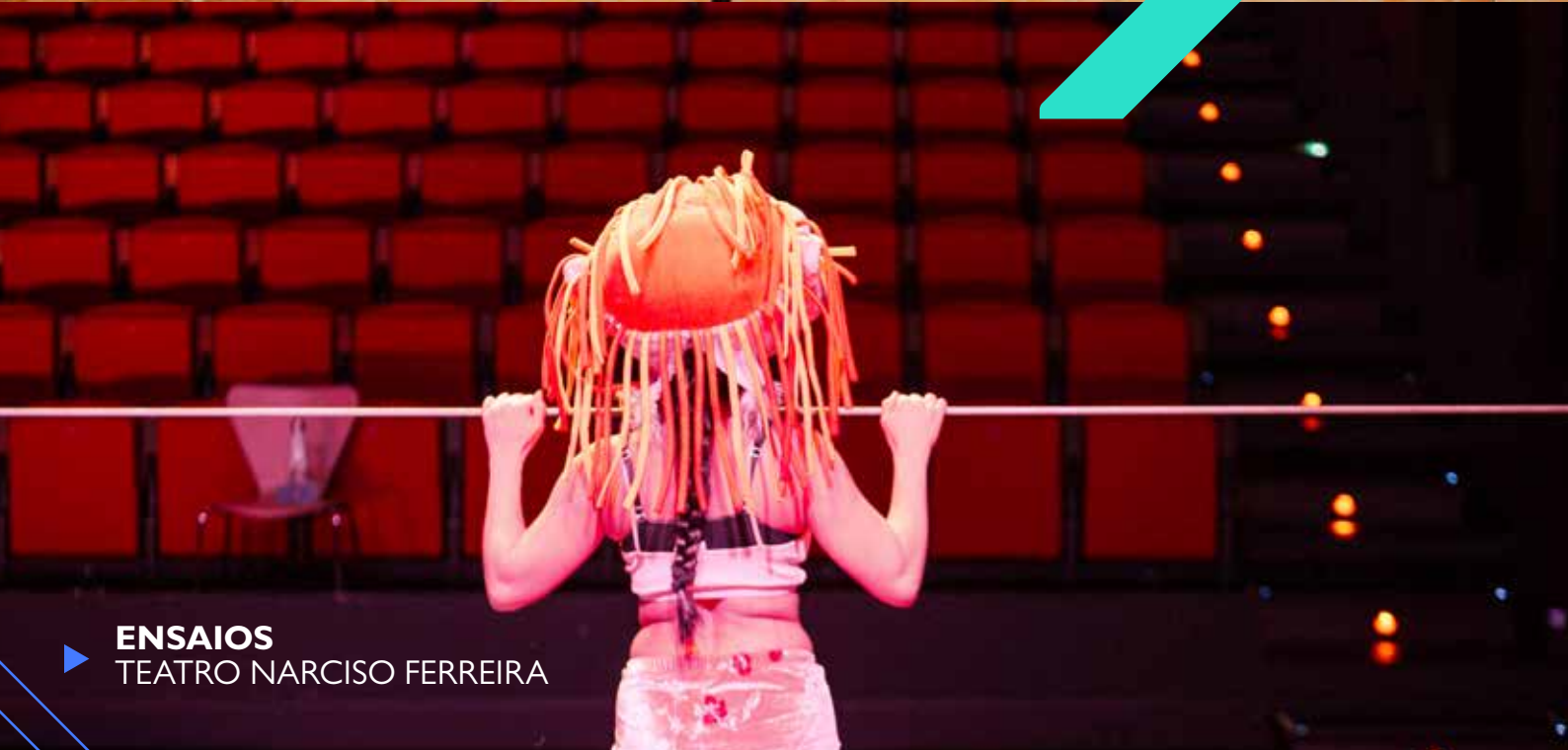
▶ ENSAIOS TEATRO NARCISO FERREIRA