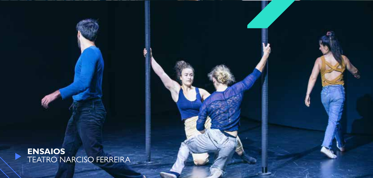
▶ ENSAIOS TEATRO NARCISO FERREIRA