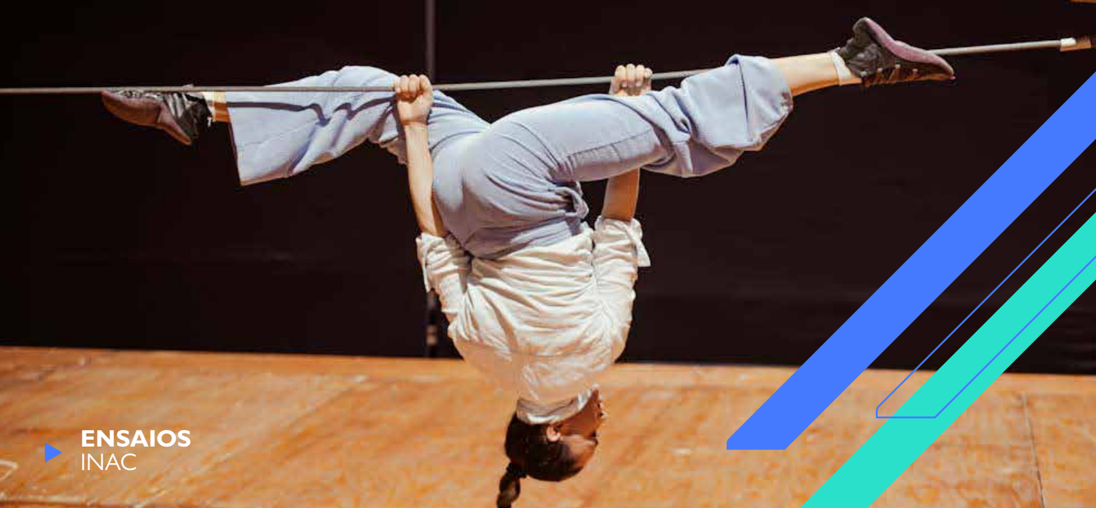
▶ ENSAIOS INAC