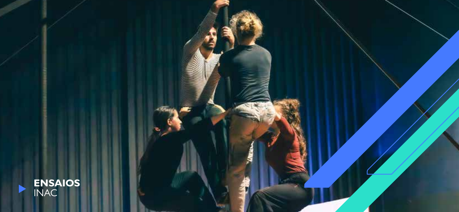
▶ ENSAIOS INAC