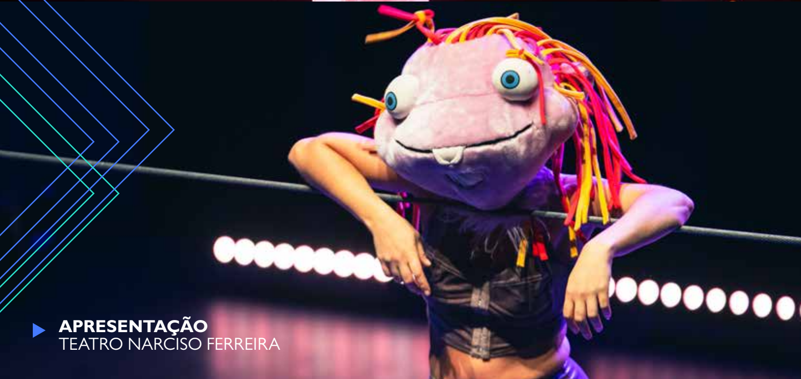
▶ APRESENTAÇÃO TEATRO NARCISO FERREIRA