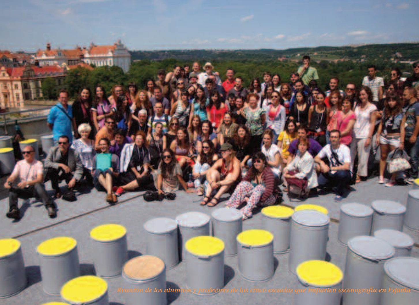
Reunión de los alumnos y profesores de las cinco escuelas que imparten escenografía en España