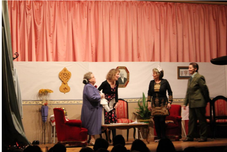
Representación de A Manda , escrita y dirigida por Javier Sánchez Sánchez.