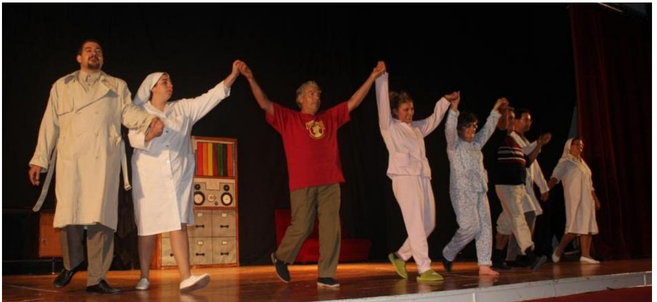
Actores de la compañía del Círculo saludando.