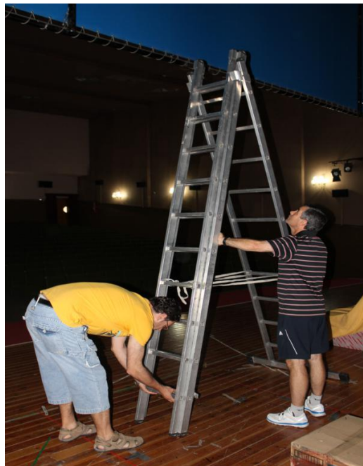
Montando en el Teatro Castilla de Arévalo.