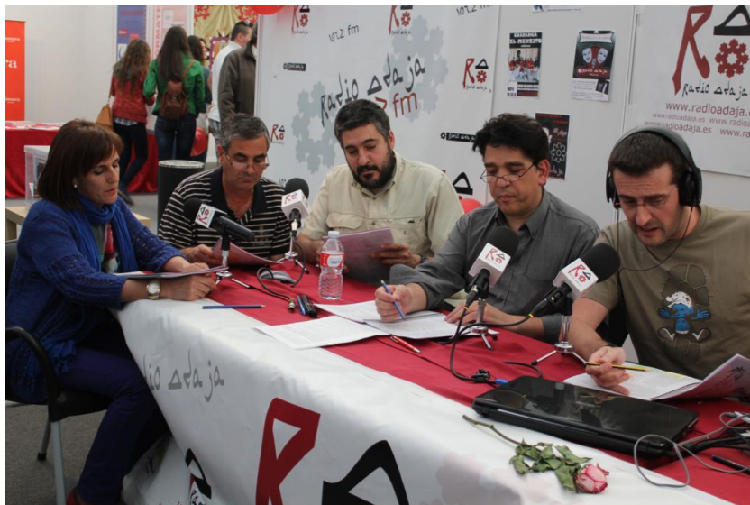
Los actores y el director interpretan la obra en la jornada Radioteatro en el stand de Radio Adaja en 2013.