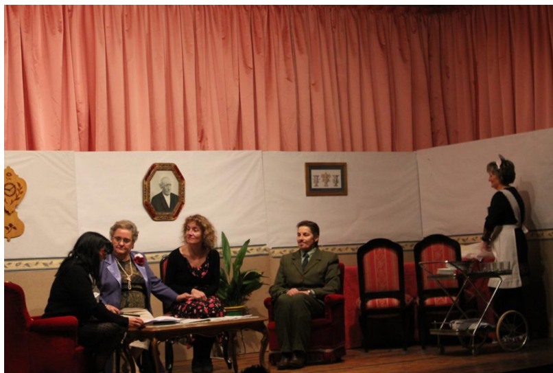
Representación de A Manda .