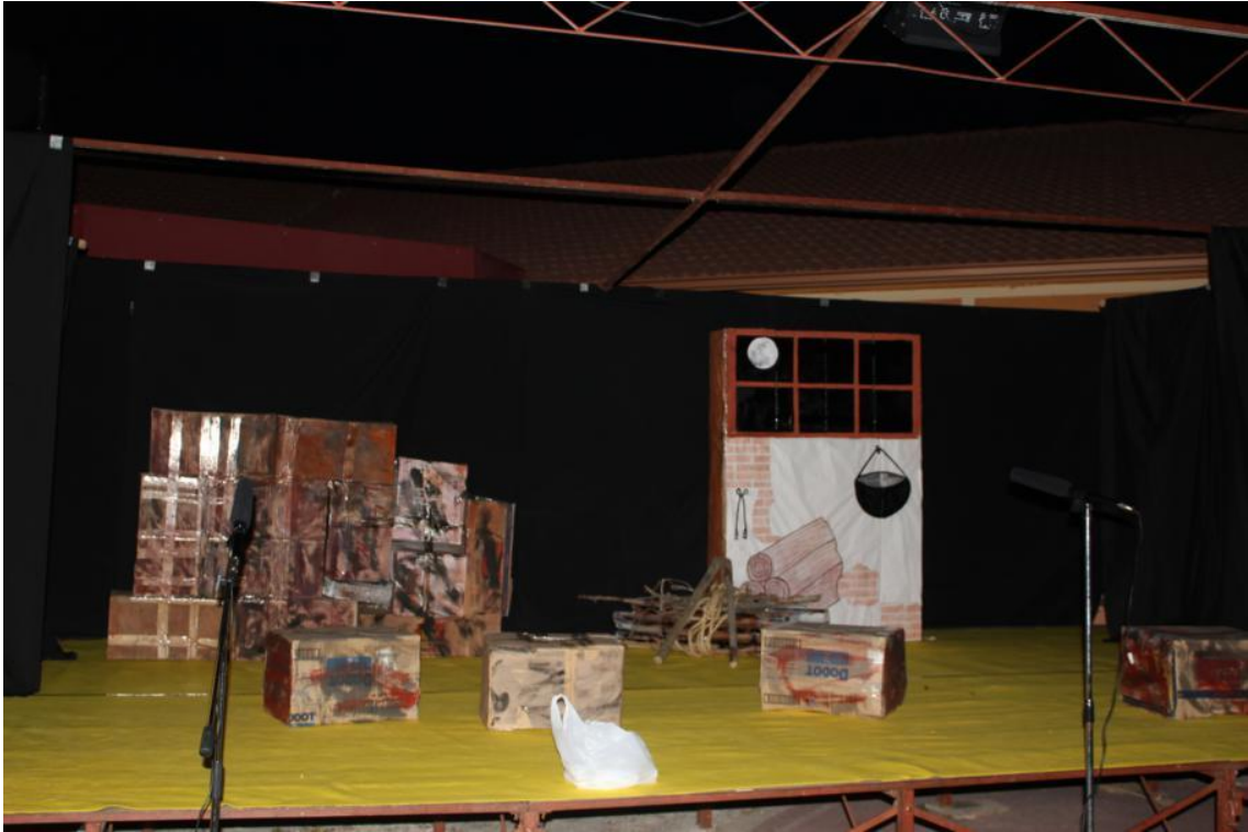
Escenografía del montaje Fuera de quicio en Carpio.