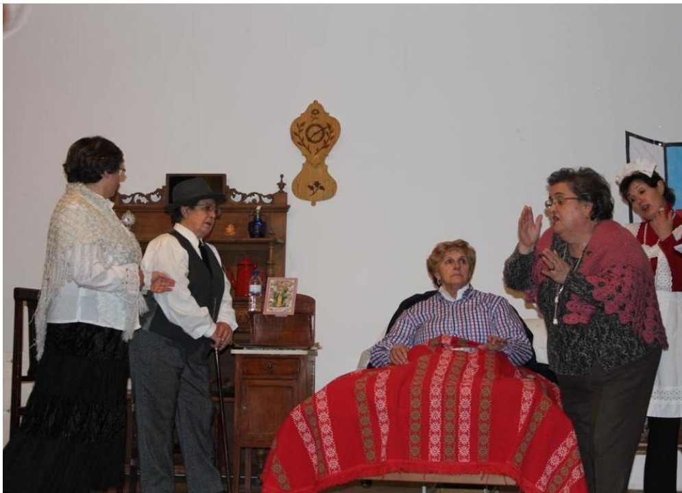
Representación de La venganza de la Petra .