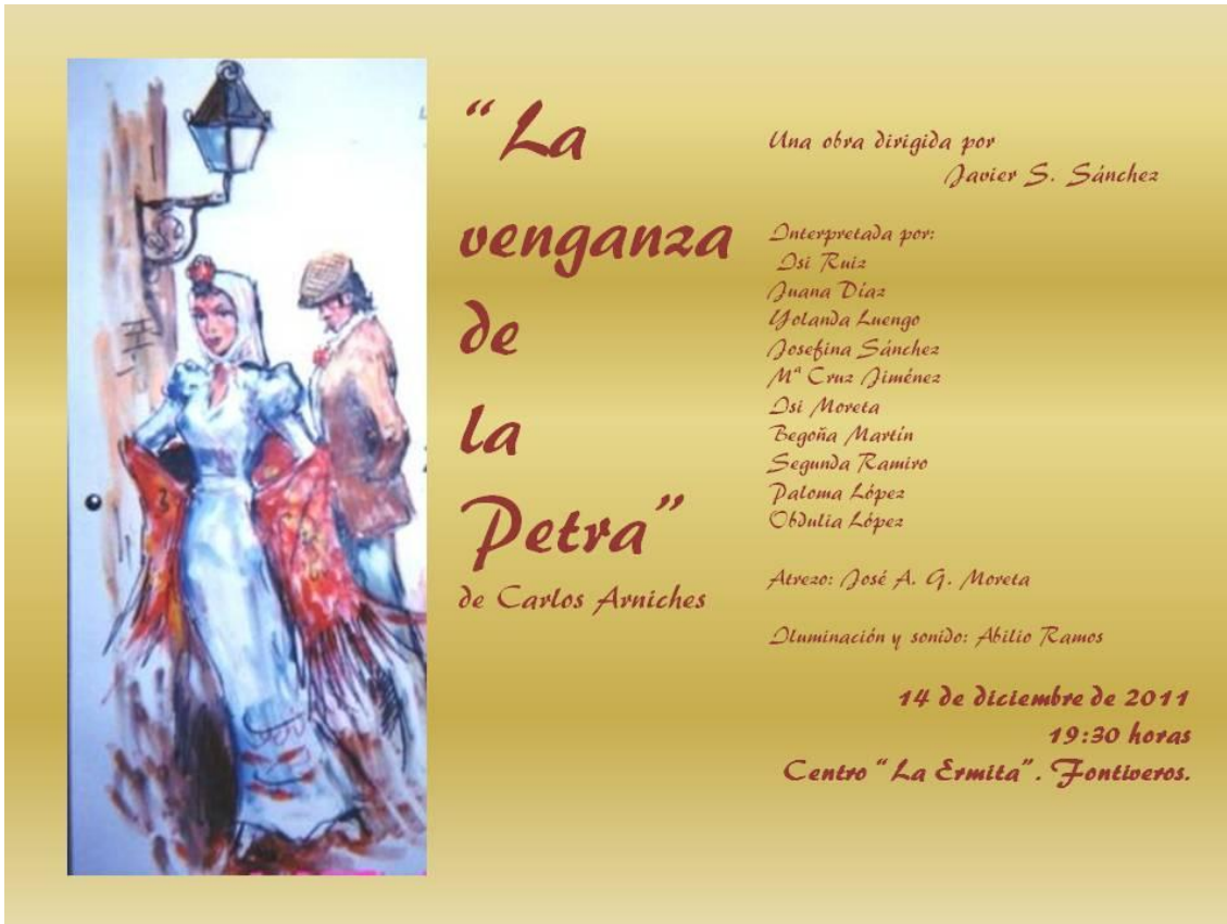
Cartel de La venganza de la Petra , escrita por Carlos Arniches y dirigida por Javier S. Sánchez en el grupo de teatro de Fontiveros (2011).