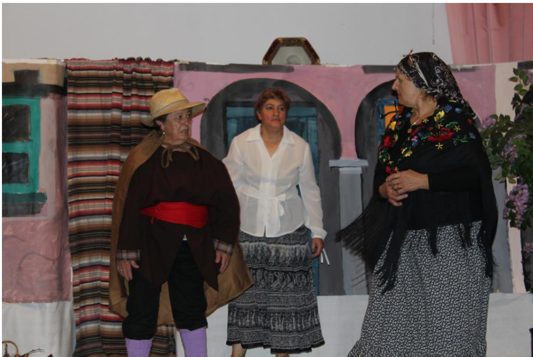
Una representación del sainete Las aceitunas (Hermanos Álvarez Quintero) interpretado por el grupo de teatro de Fontiveros.