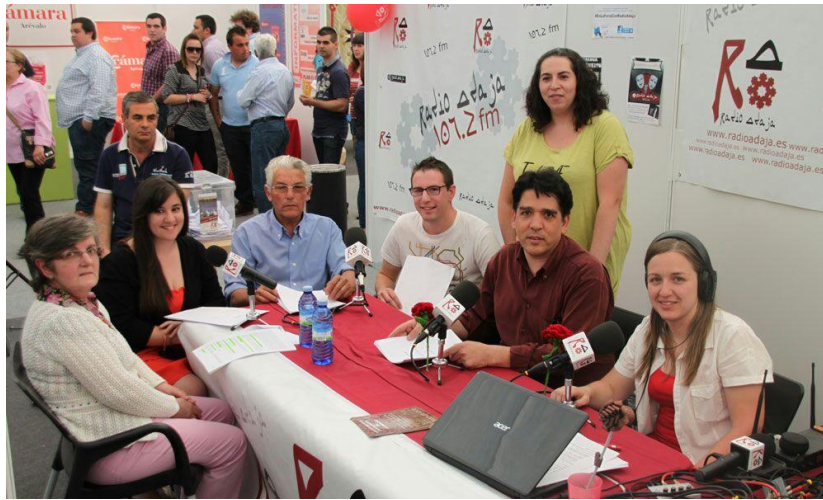
Radioteatro en el stand de Radio Adaja en 2013 de la compañía junto al personal de la empresa.