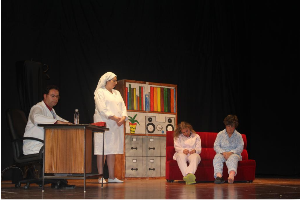
Representación Fuera de Quicio en el Teatro Castilla de Arévalo.