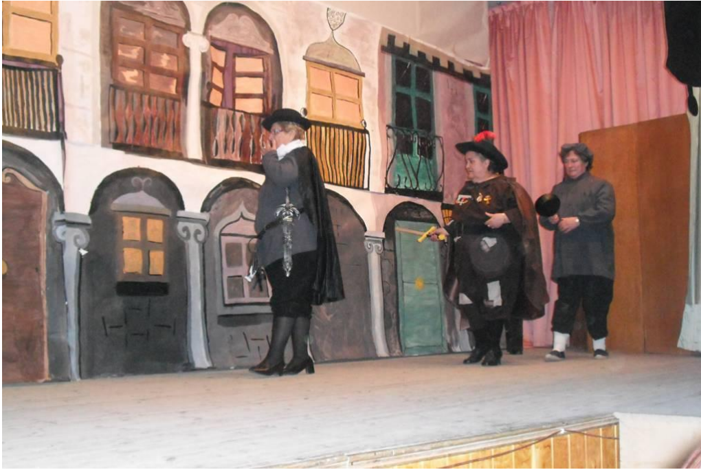
Una representación del sainete La guarda cuidadosa (Hermanos Álvarez Quintero) interpretado por el grupo de teatro de Fontiveros.