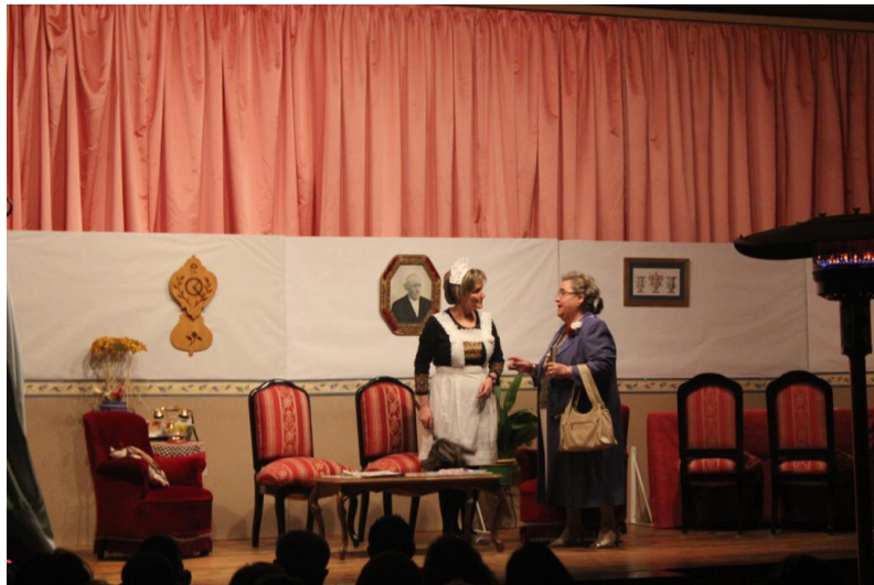
Dos de las actrices en una representación de A Manda .